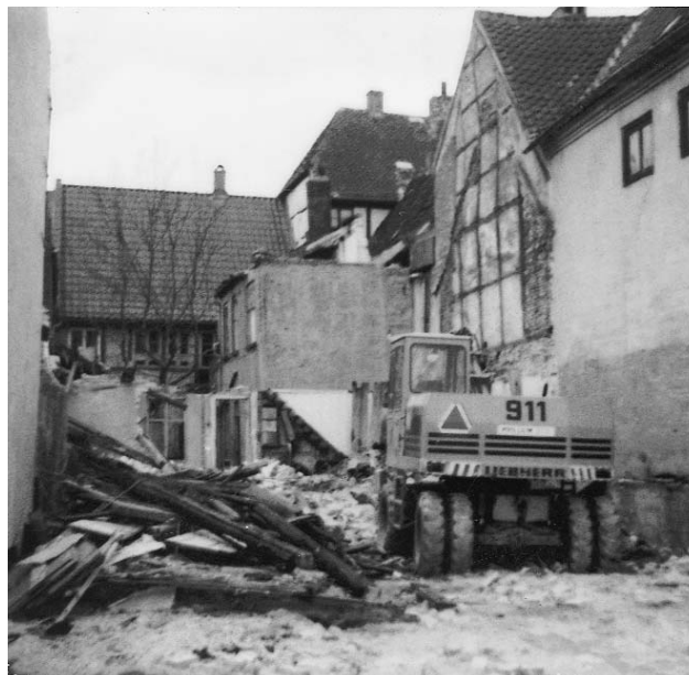
Nedrivning marts 1989.