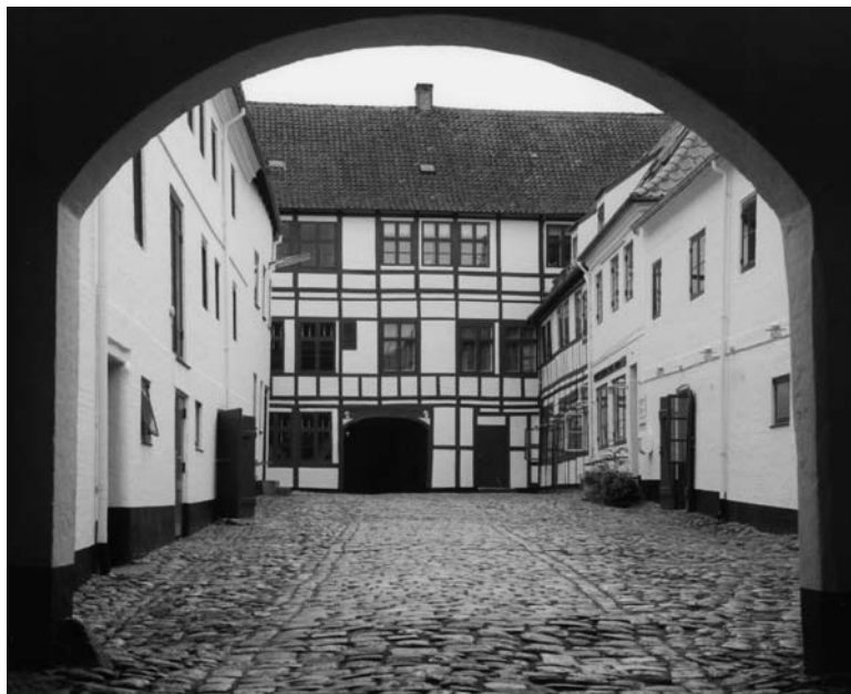
Købmandsgården Nørregade 5 Nyborg.