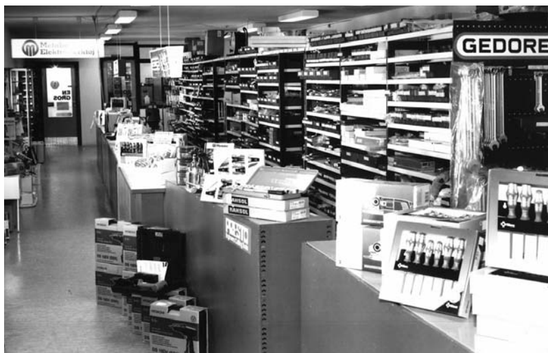
Værktøj ekspeditionslokalet 1996

I et langt sejt træk gik det mod specialisering af værktøj og tekniske artikler til industrien - egentligt et udmærket supplement til VVS engros-afdelingen. En stor sanitets- og badeværelsesudstilling blev etableret i den tidligere værktøjsbutik, og virksomheden blev salgspartner for den hollandske sanitetsproducent, Sphinx. Bad & Energi udstillingen var tænkt som en salgsudstilling i samarbejde med VVS-installatørerne,