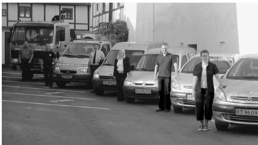
Team FNE klar til at rykke ud.