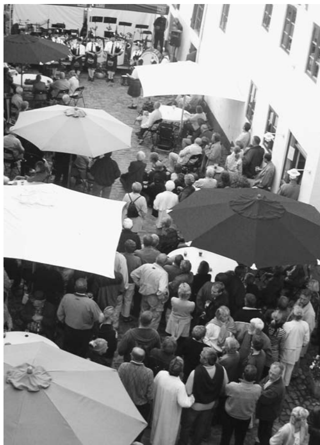
Dungillie pipeband spiller til Open by Night.

Open by Night og Nyborgs Kulturnat er blevet to gode traditioner i den gamle købmandsgård.