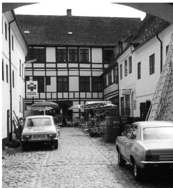
HH-byggekræmken i 1970'erne.

Imidlertid kom der også ændringer til i isenkrambranchen. Hovedparten af trælasthandelerne etablerede sig i 1970'erne med byggemarkeder og de "gamle"