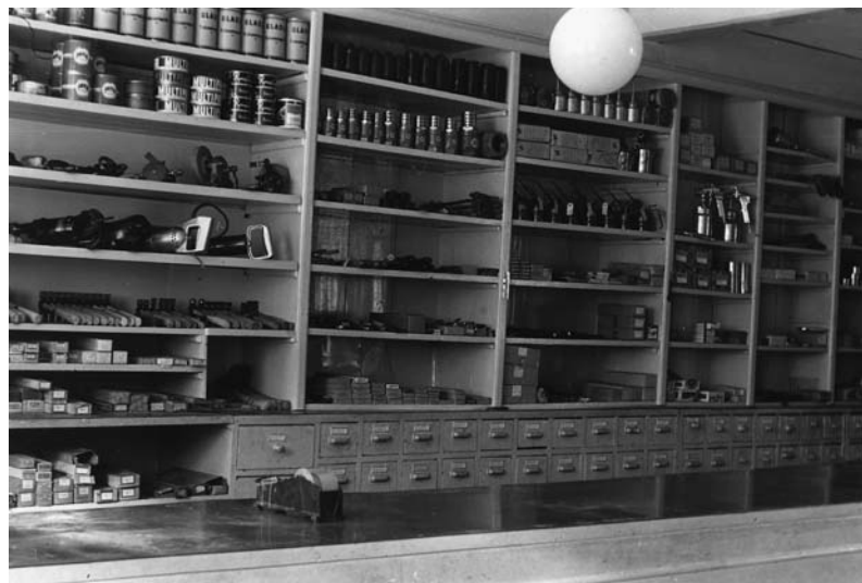
1953, Den gamle købmandsdisk med reol og skuffer fra kolonialtiden. Den gamle disk er belagt med en jernplade.

I Nørrevoldgade byggedes Fyns dengang største badeværelsesudstilling. Også pladsen mod voldgraven blev udvidet, og haller blev opført til at rumme alle de nye og større VVS artikler.